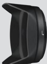
Solblender med bajonettfatning HB-75 (tilbehør som følger med)