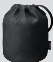
Objektivveske CL-1218 (valgfritt tilbehør)